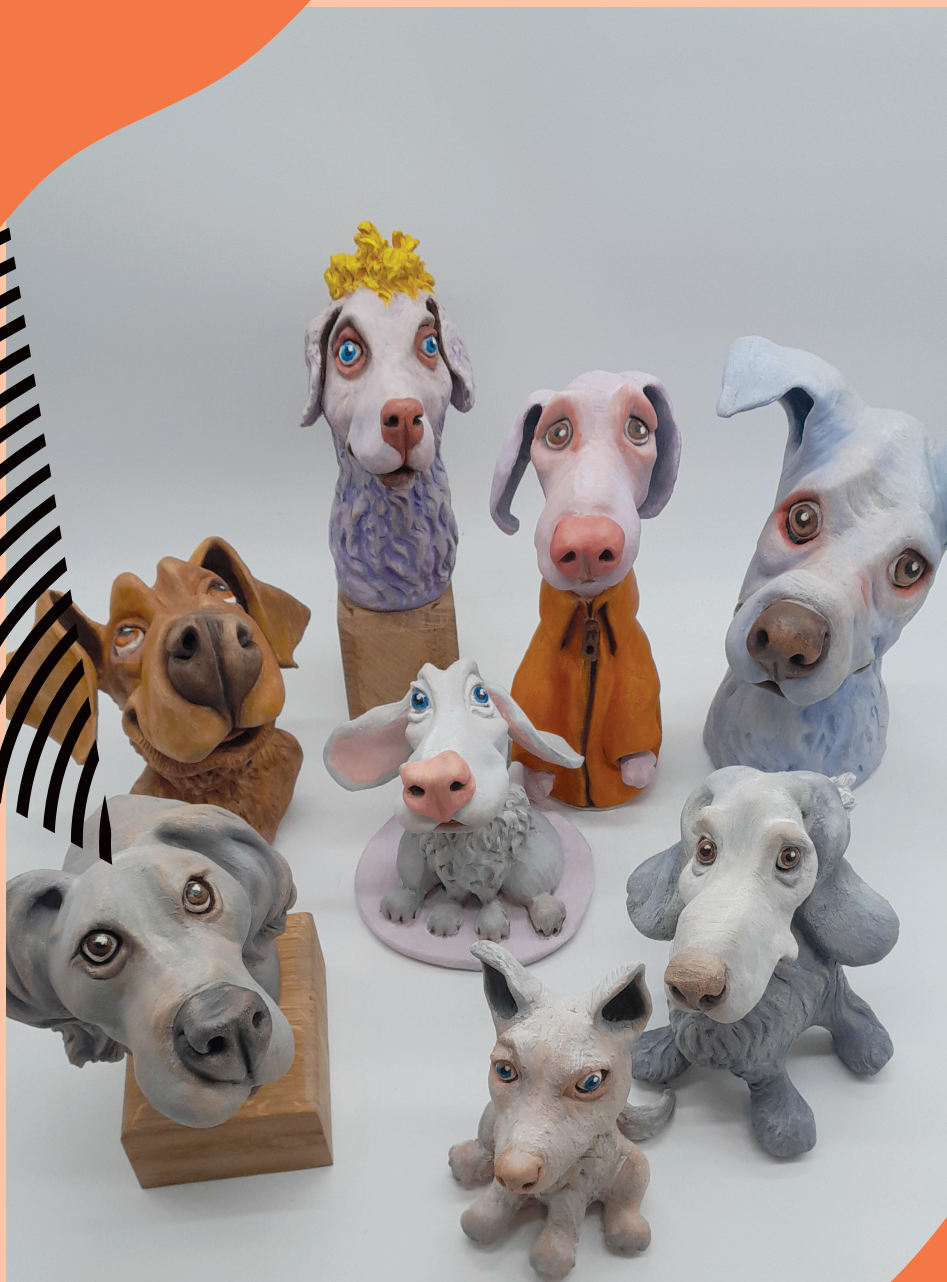
Sculptures céramiques d'Olivier Provost