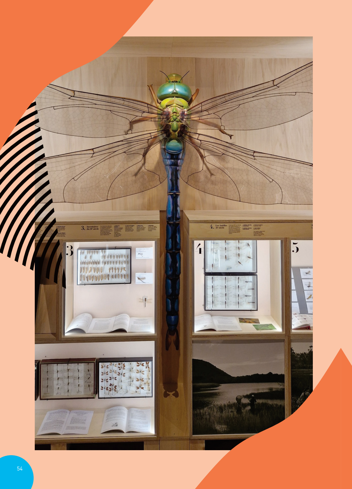
3 Inventaire du 21 e siècle